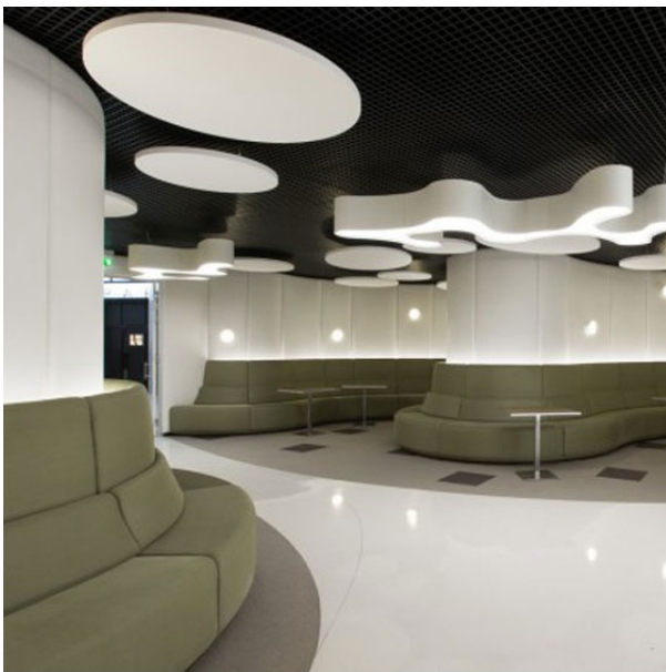
BANQUES / ASSURANCES